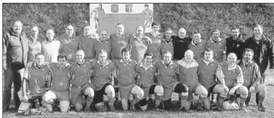
L'équipe loisir se retrouve tous les dimanches, pour des entraînements ou des matches.

Pour ceux qui trouvent que les contacts sont trop rugueux, le